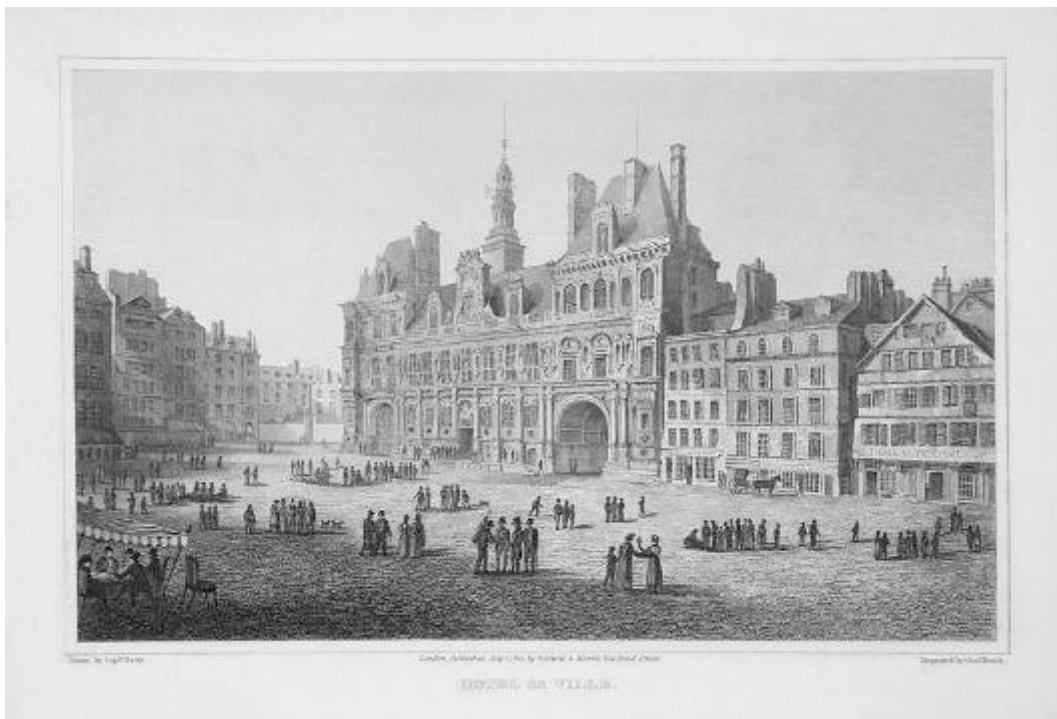
L'hôtel de ville de Calais, une gravure de Batty (1822)

L'enseigne Batty est connu: né en 1789, Robert Batty a fait ses études au Caius College à Cambridge, entre à l'armée qu'il quitte pour retourner à Cambridge pour s'y faire diplômer en 1813 et se réengage, au First Foot Guards, juste à temps pour participer aux combats des Pyrénées puis de Waterloo, où il sera d'ailleurs légèrement blessé ( slightly ) le 18 juin. Il publiera plusieurs livres illustrés de ses gravures: A Sketch of the Late Campaign in the Netherlands , 1815 An Historical Sketch of the Campaign of 1815 , 1820, Campaign of the Left-Wing of the Allied Army, in the Western Pyrenees and the South of France, in the Years 1813-1814; under Field-Marshal the Marquess of Wellington , 1823. Il restera encore assez de temps à l'armée, à l'artillerie royale, pour devenir lieutenant colonel mais il effectuera ensuite de nombreux voyages pour mieux affirmer ses talents artistiques. Ses dons de graveurs et d'aquarellistes valent ceux de conteurs mais aussi de topographe : c'est à lui que l'on doit ces cartes si souvent vues des batailles de Ligny, des Quatre-Bras et de Waterloo. Il voyagera beaucoup et publiera encore d'autres ouvrages documentaires 28 . Il décède à Londres le 20 novembre 1848.