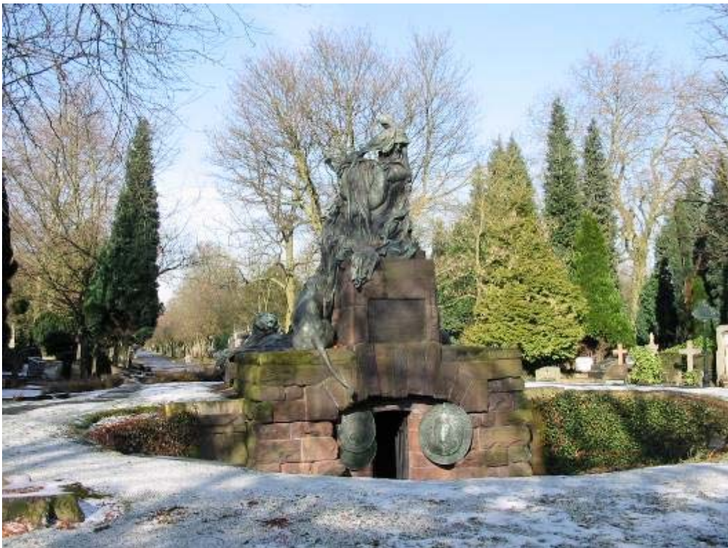
Le monument aux Anglais du cimetière de Bruxelles 8

Une souscription publique est ouverte à Londres en 1888 et les fonds récoltés, aussi bien en Angleterre qu'en Belgique permettent de poursuivre le projet. L'architecte O. Geerling soumet son projet le 20 mars 1889. Il s'agit d'une crypte installée sous un monument de 7 m 50 sur 3 m 50 surmonté de sculptures dues à Jacques de Lalaing 7 . Le montage de celles-ci commence en juillet 1890 (réalisées en bronze galvanoplastique par C. Alken) et la plaque posé au dessus de l'entrée de la crypte mentionne 1889... le socle du monument et la crypte étant terminés en juin de cette année.